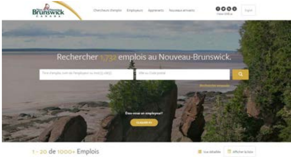
Figure 1 : Capture d'écran du nouveau site Web emploisNB.ca