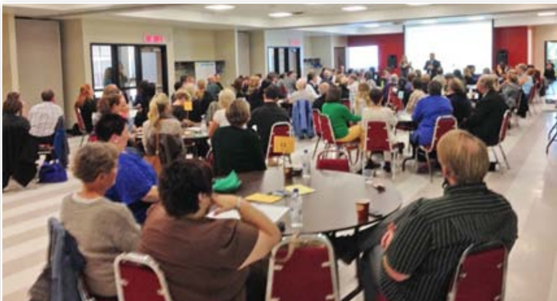
Dialogue public Fredericton, le 9 octobre 2013

28. Promouvoir et soutenir les systèmes de transports communautaires alternatifs.