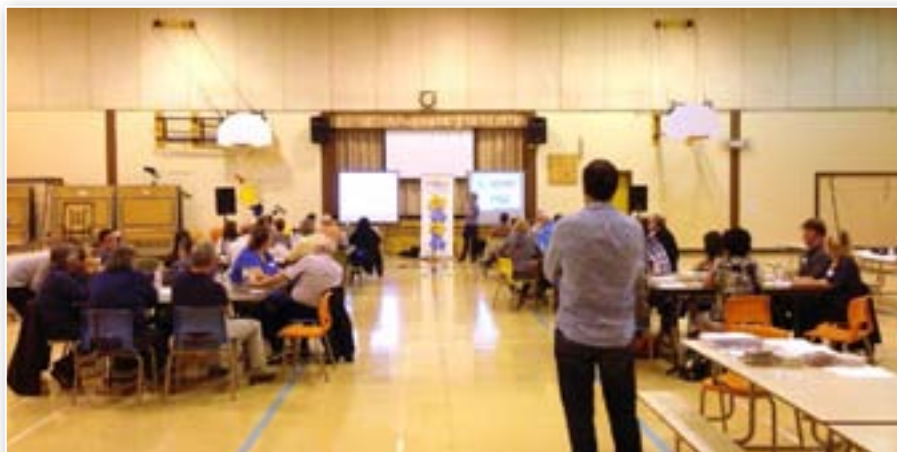
Dialogue public Pokemouche, le 18 septembre 2013

Conformément aux exigences de la Loi, la SIÉS doit soumettre un rapport annuel et, à tous les deux ans, un rapport d'étape qui fait état des progrès accomplis dans la mise en œuvre du Plan.