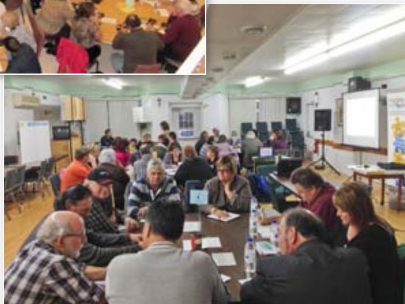
Dialogue public Saint-Léonard, le 23 sept. 2013