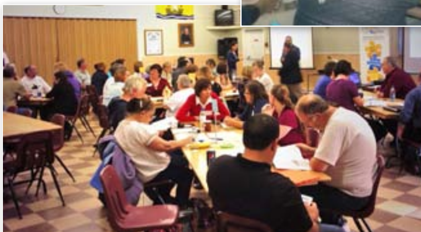
Dialogue public Miramichi, le 17 septembre 2013