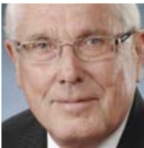
Gerry Pond Entreprises