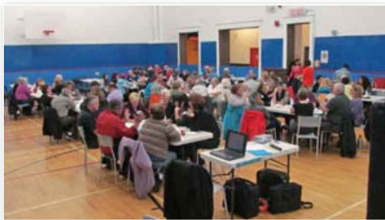
Dialogue public Saint John, le 8 octobre 2013