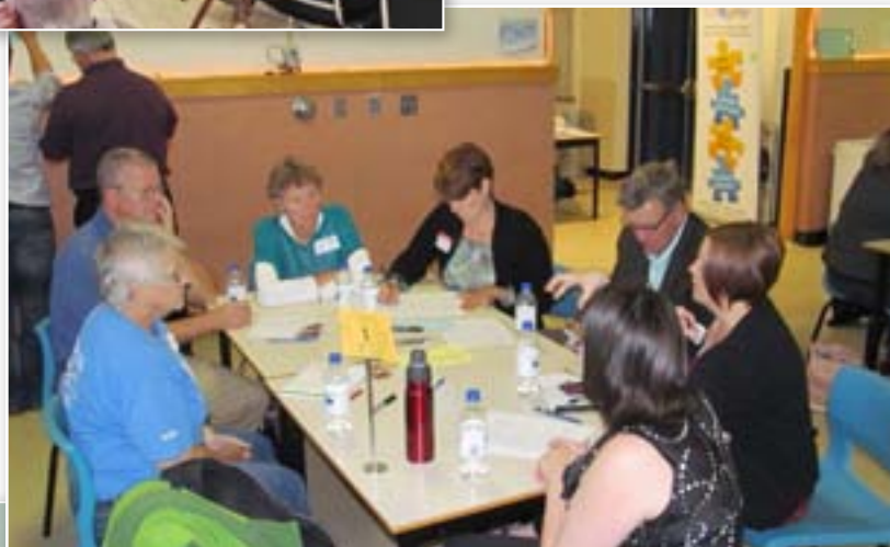
Dialogue public Burt's Corner, le 1 octobre 2013