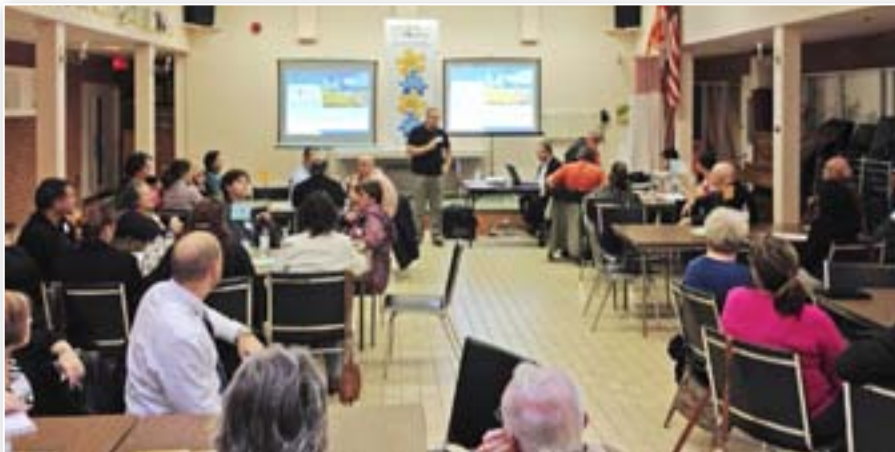
Dialogue public Campbellton, le 24 septembre 2013

Dans l'esprit du premier plan d'inclusion économique et sociale, les efforts seront maintenus afin de favoriser l'inclusion économique et sociale et réduire la pauvreté de l'ensemble de la population du Nouveau-Brunswick en renforçant les capacités de chaque communauté et en facilitant la collaboration des partenaires des quatre secteurs. L'accent sera maintenu sur la réduction de la pauvreté monétaire de 25 p. 100 et la pauvreté monétaire extrême de 50 p.100.