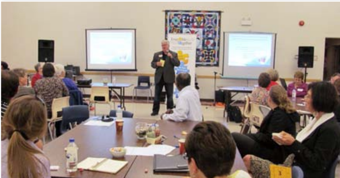
Dialogue public Florenceville-Bristol, le 30 septembre 2013