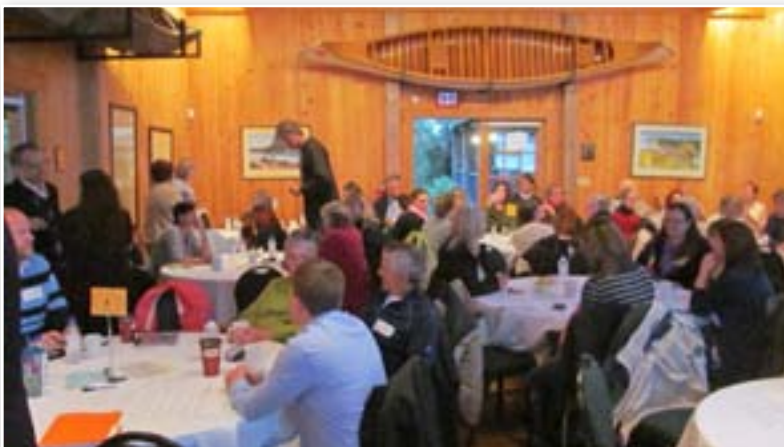
Dialogue public St. Andrews, le 7 octobre 2013

Ensemble pour vaincre la pauvreté: Le plan d'inclusion économique et sociale du Nouveau-Brunswick 2014-2019 maintient l'engagement envers les actions du premier plan d'inclusion économique et sociale. Continuer de développer et de mettre en œuvre des modèles intégrés de prestation des services axés sur les individus, revoir le salaire minimum, atténuer les obstacles à l'éducation permanente, résoudre le problème de disponibilité de places dans les garderies réglementées et faire la promotion de l'inclusion économique et sociale demeureront parmi les priorités de ce plan.