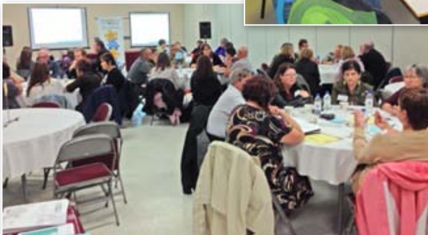
Dialogue public Bathurst, le 25 septembre 2013