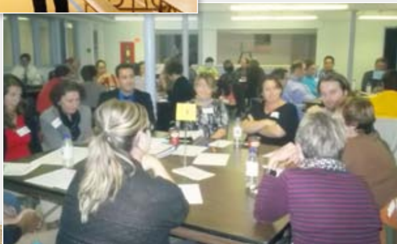
Dialogue public Richibucto, le 16 septembre 2013